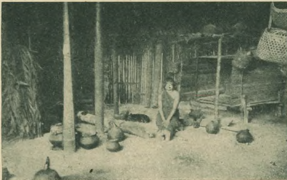
Interno di una capanna Jivara.

delle Suore, viaggi lunghi e frequenti non gli lasciavano un momento di riposo. Sua preoccupazione continua era di tener in fiore dappertutto lo spirito genuino di Don Bosco. I suoi scritti contengono tesori di quella dottrina schiettamente salesiana, che andava spargendo a voce nelle comunità, in fiore di ricordi personali su Don Bosco e l'Oratorio.