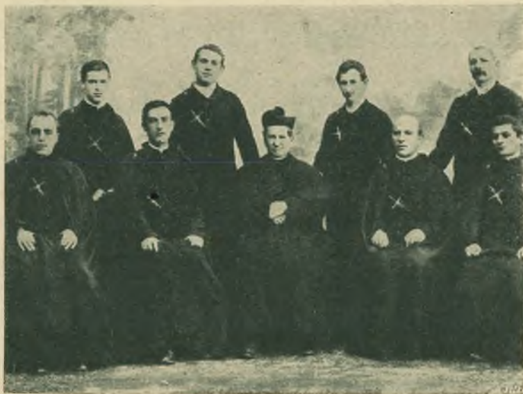
La prima spedizione per la Missione Salesiana dell'Equatore.

Il Papa, com'era da aspettarsi, il 30 gennaio 1889, altamente encomiando l'atto del Governo, assicurava il Presidente della Repubblica, che la petizione formava l'oggetto delle sue maggiori sollecitudini e che egli aveva già dato l'incarico a persone prudenti di esaminare la cosa e di cercare il miglior mezzo per condurla a felice esito. Pratiche di tal natura esigono tempo, giacchè in simili negozi la Santa Sede suole andare con piè di piombo; onde, per limitarci a quello che riguarda noi, soltanto