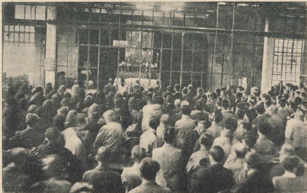
Torino - La S. Messa per gli operai in una fabbrica.

Qualche breve nota pervenuta nei mesi estivi mostra l'attività svolta dalle Figlie di Maria Ausiliatrice francesi durante il periodo delle vacanze per poter rispondere sempre meglio alle esigenze della Nazione, che orienta la sua opera di ricostruzione morale e sociale