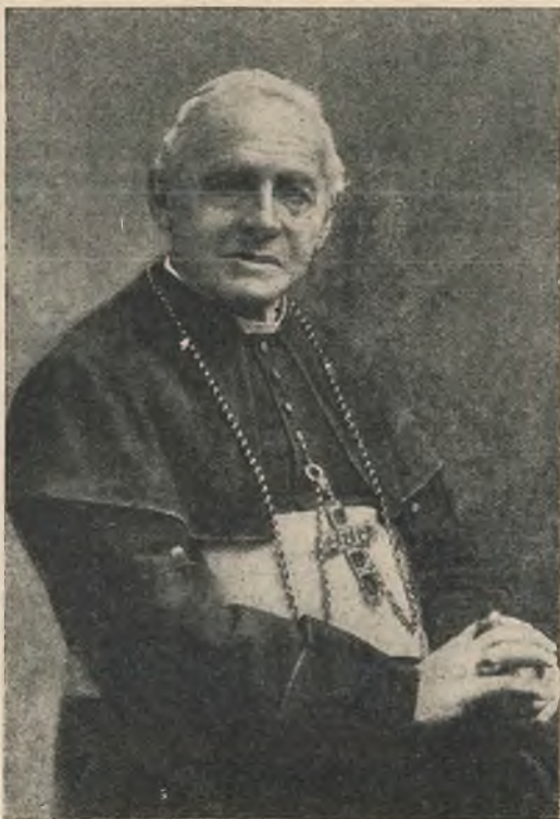
Il primo Vicario Apostolico S. E. Mons. Costamagna.

carabine, che erano il loro spavento. Allora abitava presso una cappelletta uno zelante P. Pozzi, Missionario della Compagnia di Gesù, che i selvaggi sospettavano essere d'intesa con gli armati per opprimere la loro libertà; onde un bel giorno gl'incendiarono la casa e quanto in essa si conteneva. Per questo e per altri motivi il Gesuita si allontanò di là nè più si fece vedere. Venuti poi i Salesiani, sebbene non vi fossero più militari, tuttavia alcuni Indi entrarono in dubbio che anch'essi avessero intenzione di attentare alla loro indipendenza; perciò, colto il momento propizio, il 17 dicembre, mentre in chiesa si cantavano le Profezie del Natale, appiccarono il fuoco al laboratorio dei fabbri. Le fiamme investirono il tetto di materia combustibile e in men di dieci minuti invasero l'intera casa, incenerendovi quanto vi stava dentro, come se fosse un gran mucchio di paglia. Per fortuna la cappella, essendo un po' distante, rimase intatta. Ma il peggio si fu che viveri per due mesi, mobilia per una cinquantina di ragazzi interni, una biblioteca dei libri più necessari, una discreta farmacia, i paramenti sacri, strumenti di meteorologia e di astronomia, attrezzi per falegnami, sarti,