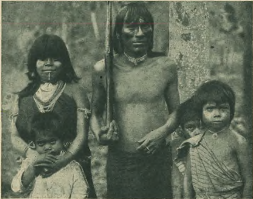
Una famiglia di Jivari.