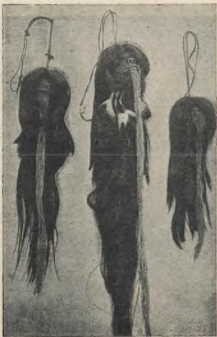
Come vengono ridotte le teste delle vittime di barbare vendette.